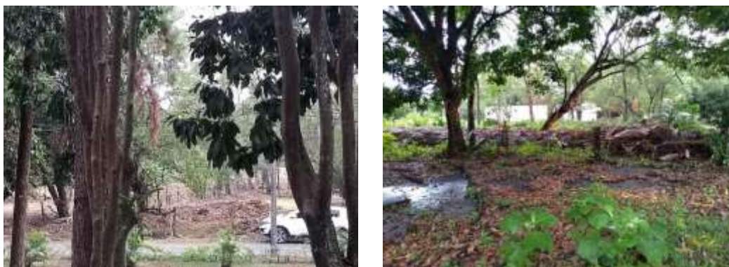
Figura 3. Sector tanque elevado de agua potable