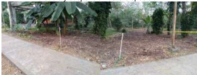
Figura 4. Sector tanque elevado de agua potable después de la incorporación del material vegetal a suelo y suspensión de la disposición.

Para saber cuánto material vegetal se generaba en el campus, durante una semana (lunes a sábado) se acumularon residuos de hojarasca y poda en la compostera y en el área temporal, luego con ayuda de dos operarios se pesó y se sacó el volumen del material, arrojando los siguientes resultados: