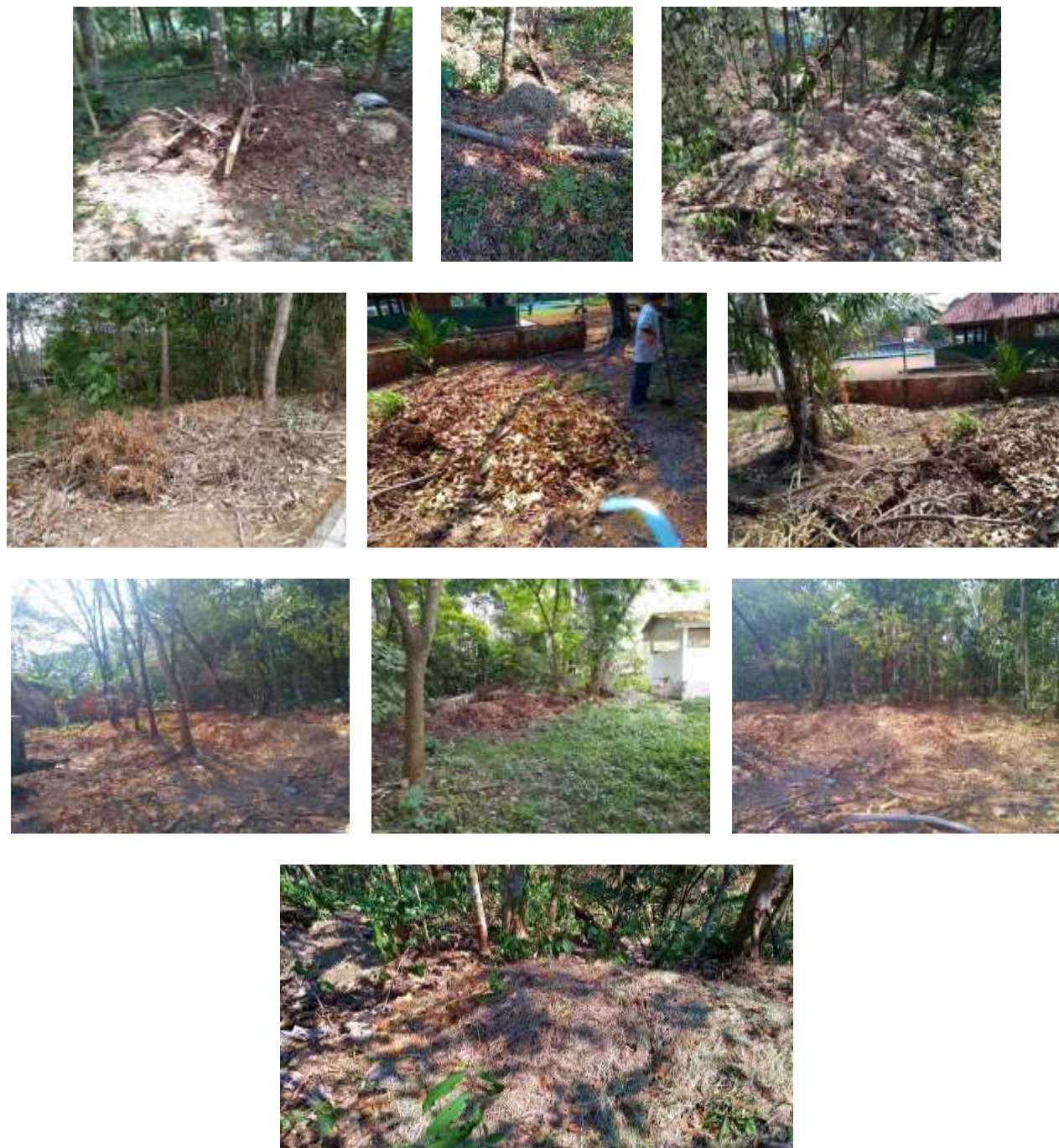
Figura 1. Disposición de residuos vegetales en la ronda del canal de drenaje de aguas lluvias.

A finales del año 2018 e inicios de 2019 con el fin de dejar de usar la ronda del canal para la disposición de los residuos vegetales tales como: poda de césped y jardín, hojarasca, ramas entre otros, la oficina de servicios generales establece dos sectores para ubicar estos residuos: el primer sector estaba ubicado detrás del edificio administrativo y el segundo estaba al lado del tanque elevado de agua potable contiguo a la sala de necropsia. (Figura 2 y 3).