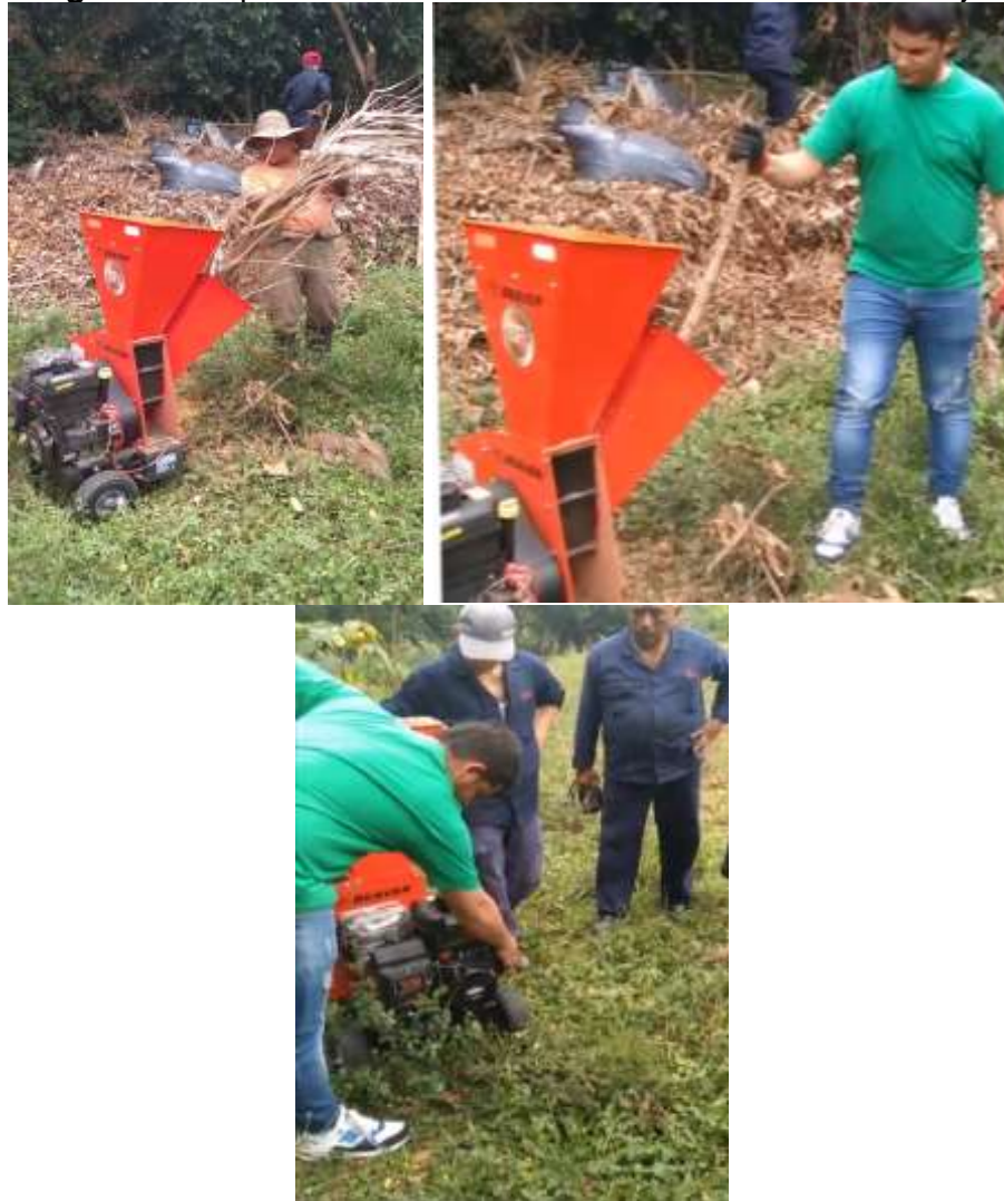
Figura 8. Chipeadora PRO 400 Beaver - Inducción en el manejo

Se adquiere un equipo de trituradora (chipeadora) para dar manejo a los residuos vegetales, reducir el volumen in situ y permitir una descomposición más rápida de los residuos ( Figura 8 ).