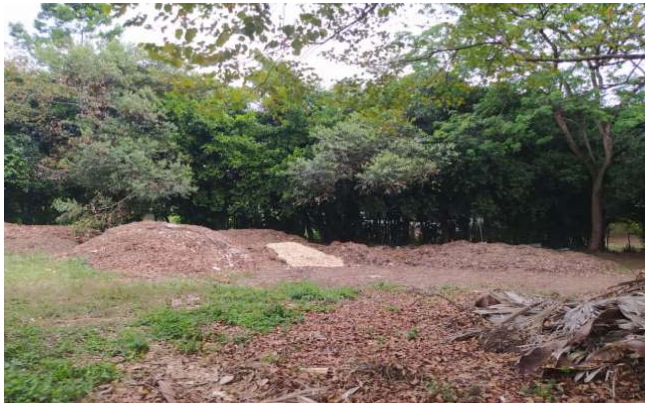
Figura 5. Área de la compostera del Campus Barcelona

La compostera está ubicada en un área de 500 m 2 atrás del edificio Albert Einstein contiguo al área de los ovinos ( Figura 6 ). Esta área ya se encuentra demarcada, con accesibilidad para peatón y cualquier tipo de transporte en caso de requerirse.