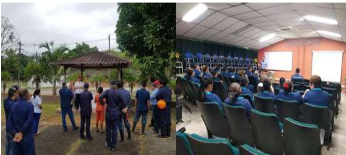
Figura 7. Socialización a las personas de servicios generales y del aseo tercerizado.

Definida la zona de la compostera, se socializa a todo el personal de servicios generales y del servicio de aseo tercerizado ( Figura 7 ) el inicio de las actividades en la compostera, con el objetivo, que todos conozcan el sitio permitido para disponer los residuos vegetales, que se hará de forma permanente y que no se permitirá disponer en otros sitios diferentes al ya mencionado, dando así orden a estos residuos y permitiendo mejorar el paisaje de las áreas verdes del Campus.