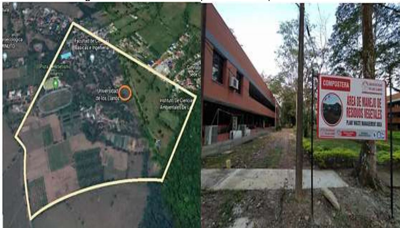
Figura 6. Ubicación de la compostera del Campus Barcelona