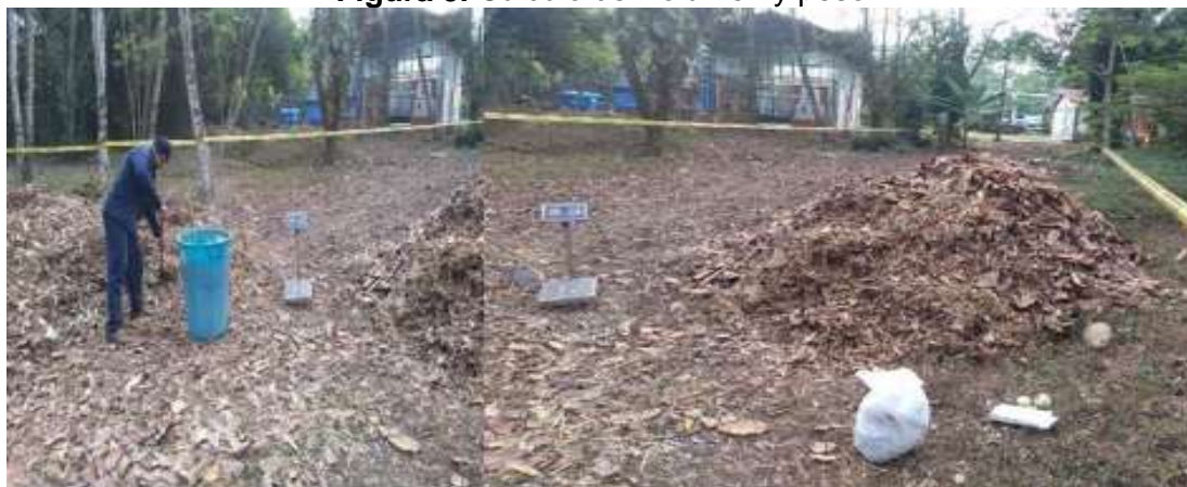
Figura 9. Cálculo del volumen y peso.

Según el conocimiento y guía del docente de agronomía a cargo de la Biofábrica, del cien por ciento (100%) del material vegetal que se dispone a tratamiento solo un sesenta por ciento (60%) de su peso se transforma en compost. por lo que si mensualmente se recogen 2.332 kilos de residuos vegetales solo 1399 kilos se aprovechan, obteniendo 28 bultos de 50 kilos cada 2 meses aproximadamente.